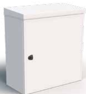
Rozvaděč – venkovní provedení