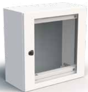
Rozvaděč s prosklenými dveřmi